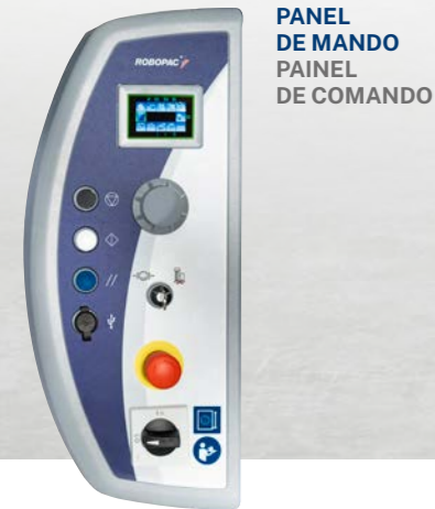
PANEL DE MANDO PAINEL DE COMANDO