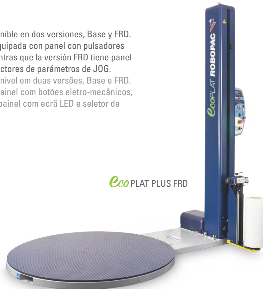
EcoPLAT PLUS FRD

Ecoplat Plus está disponible en dos versiones, Base y FRD. La versión base está equipada con panel con pulsadores electromecánicos, mientras que la versión FRD tiene panel con pantalla LED y selectores de parámetros de JOG. Ecoplat Plus está disponível em duas versões, Base e FRD. A versão base possui painel com botões eletro-mecânicos, e a versão FRD possui painel com ecrã LED e seletor de parâmetros por JOG.